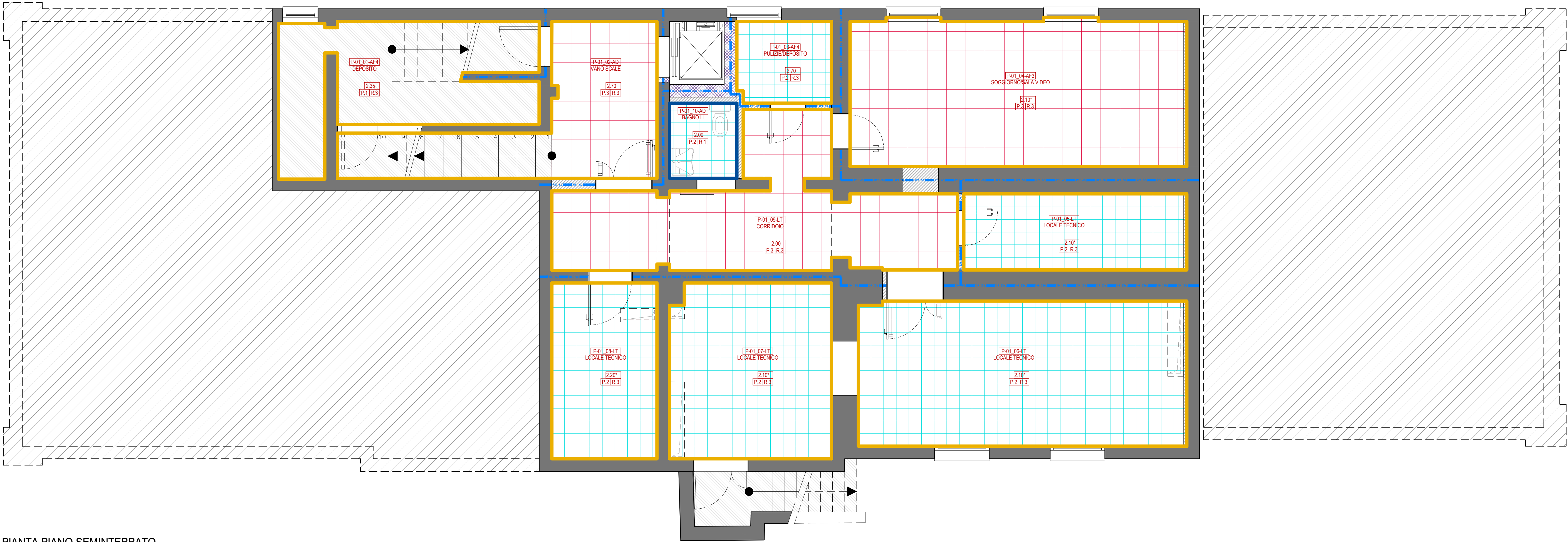
PIANTA PIANO SEMINTERRATO