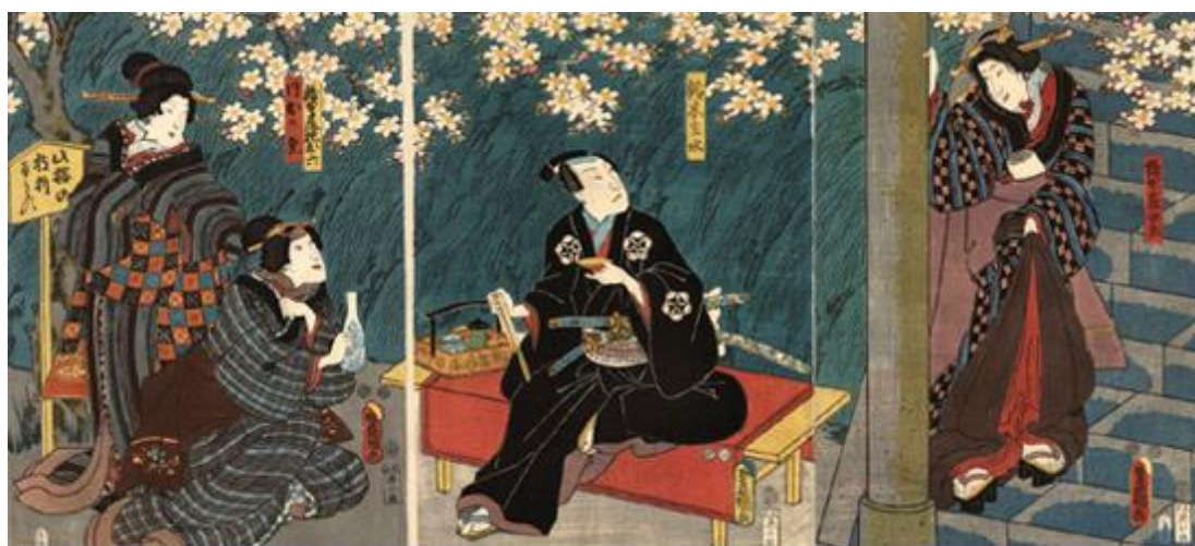
LABORATORI E VISITE GUIDATE