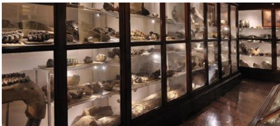
LABORATORI E VISITE GUIDATE