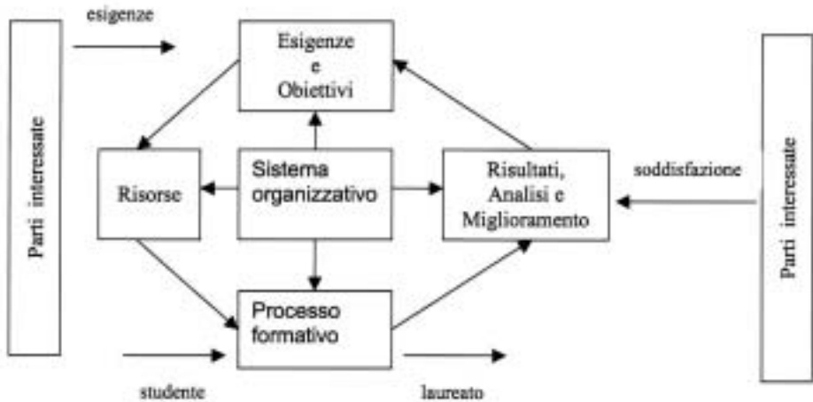
Figura 1: Schema del Modello CampsuOne

Di seguito è sinteticamente descritta l'impostazione generale del Modello CampusOne con riferimento alle cinque dimensioni della valutazione individuate.