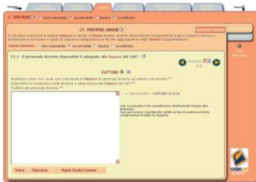
Figura 3: Schermata del software per la redazione dei rapporti di autovalutazione

Inoltre, per facilitare ulteriormente la compilazione e guidare i corsi di studio CampusOne nella stesura del rapporto di autovalutazione, la CRUI ha individuato un gruppo di esperti con i quali ha organizzato un'attività di tutoraggio. In tal modo ciascun ateneo può avvalersi della competenza e della consulenza di un tutore per chiarire eventuali dubbi o incertezze emersi nel corso della redazione del rapporto.