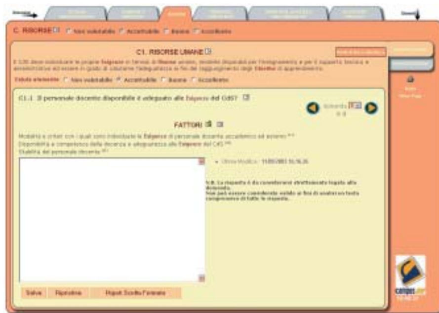
Figura 3: Schermata del software per la redazione dei rapporti di autovalutazione

Inoltre, per facilitare ulteriormente la compilazione e guidare i corsi di studio CampusOne nella stesura del rapporto di autovalutazione, la CRUI ha individuato un gruppo di esperti con i quali ha organizzato un'attività di tutoraggio. In tal modo ciascun ateneo può avvalersi della competenza e della consulenza di un tutore per chiarire eventuali dubbi o incertezze emersi nel corso della redazione del rapporto.