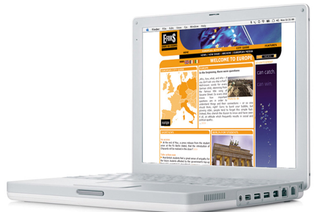
Il sito www.efors.eu

WORK|OUT dispone di numerosi contatti con diversi media come quotidiani, portali web e istituti culturali. Abbiamo previsto la comunicazione, a scadenze periodiche, di tutte le informazioni riguardanti il progetto tramite l'ufficio stampa e i media associati. Annoveriamo tra i sostenitori dei nostri progetti – in questo caso degli eventi di presentazione di UniScout e dell'annuale libro “Best of Young European Journalism” – solitamente le fondazioni culturali, i fondi universitari, regionali ed europei per la cultura, le cooperative e le imprese.