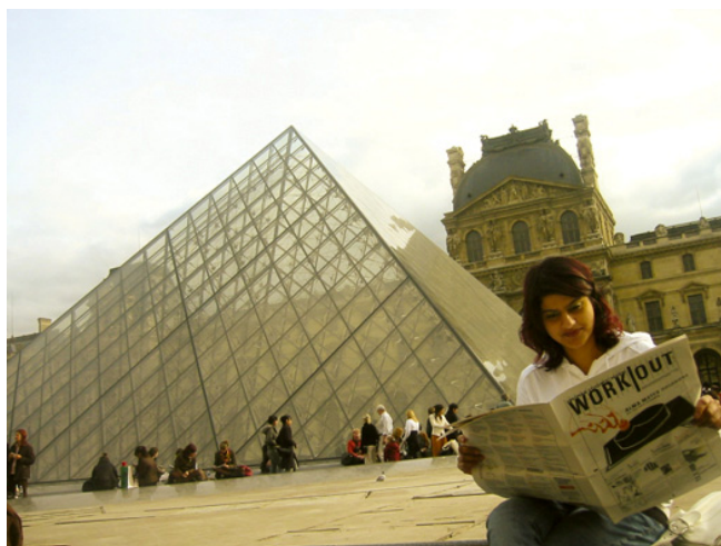
Una lettrice di WORK|OUT a Parigi

Dal grembo di WORK|OUT – fondato nel 1999 – è nato il portale web multilingue www.efors.eu che fornisce informazioni essenziali per la mobilità, lo studio e l'orientamento. E nella sezione Citypages del sito internet si offre a gruppetti locali l'opportunità di produrre un giornale web nella propria città.